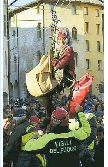
Nelle foto di Michele Missinato la befana in volo e il pubblico in attesa, in quelle dei vigili del fuoco il lancio dall'alto e il lavoro nel campanile