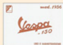
Vespa 150 (1956)