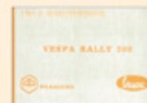
Vespa 200 Rally (1972)