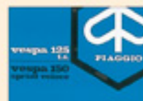
Vespa 150 Sprint Veloce 125 TS (1975 Sec. Ed.)