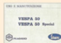
Vespa 50 - 50 Special (prima serie)