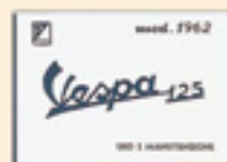
Vespa 125 (1962)