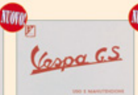
Vespa 150 GS (1958)