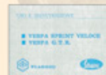
Vespa 150 Sprint Veloce 125 GTR (1969)