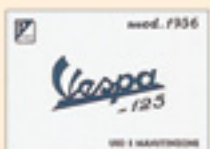
Vespa 125 (1956)