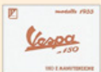
Vespa 150 (1955)