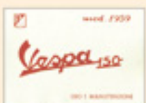
Vespa 150 (1959)