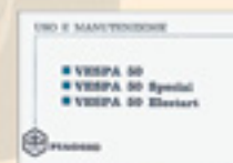
Vespa 50 - 50 Special - 50 Elestart (sec. serie)