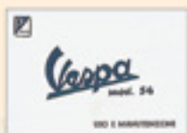
Vespa 125 (1954)