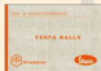
Vespa 180 Rally (1968)