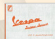
Vespa 180 Super Sport (1965)