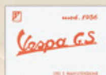
Vespa 150 GS (1956)