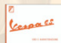
Vespa GS (1963)