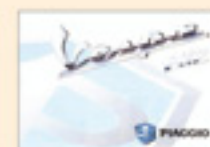
Vespa ET2 (1999)