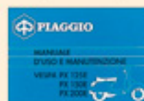
Vespa PX 125 E, PX 150 E, PX 200 E Arcobaleno (1983)