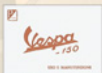
Vespa 150 (1957)