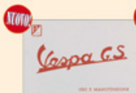
Vespa 150 GS (1955)