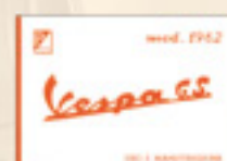
Vespa GS (1962)