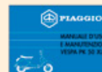
Vespa PK 50 XL