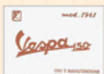
Vespa 150 (1961)