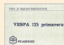
Vespa 125 Primavera (1968)