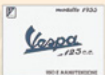
Vespa 125 (1955)