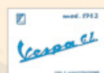
Vespa GL (1963)