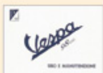
Vespa 98 seconda serie (1946)