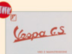
Vespa 150 GS (1959/1961)