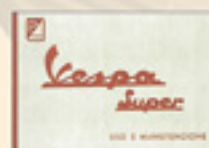
Vespa 125 - 150 Super (1965)