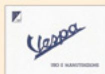
Vespa 98 prima serie (1946)