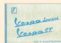
Vespa 150 Sprint - GT (1965 - 1966)