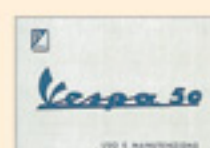
Vespa 50 (1963)