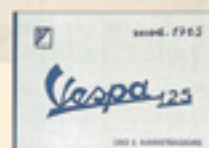
Vespa 125 (1965)